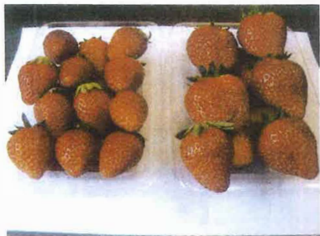
スカロープレミアム 未配合