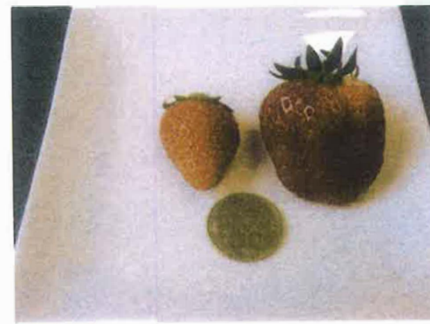
スカロープレミアム 未配合